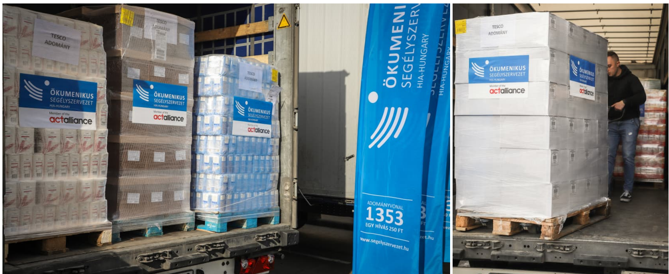
Erste Hilfsgüter werden von Ungarn in den Süden der Ukraine gebracht.

Die Partnerorganisation der Diakonie Katastrophenhilfe, Hungarian Interchurch Aid (HiA), hat bereits am Samstag zwei Lastwagen mit Hilfsgütern für die Ukraine auf den Weg gebracht, um dort Flüchtlinge zu unterstützen. Insgesamt 28 Tonnen Lebensmittel wie Konserven, Mehl, Zucker, Öl, Reis, Nudeln, Kekse, H-Milch, Tee und Hygieneartikel sind Teil des Transports. Ziel sind die Zentren Beregszász und Uzhhorod im Grenzgebiet zu Ungarn im Südwesten der Ukraine. Die Waren werden an Familien verteilt, die aufgrund des Krieges aus ihrer Heimat fliehen mussten.